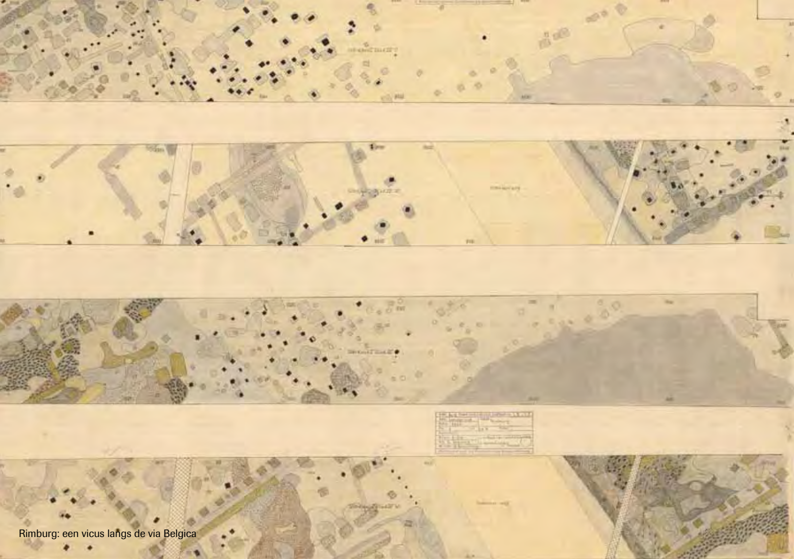
Rimburch: een vicus langs de via Belgica