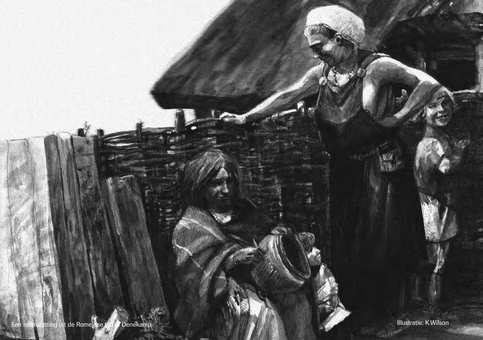
Een nederzetting uit de Romeinse tijd in Denekamp